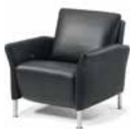
Fauteuil Fauteuil Armchair