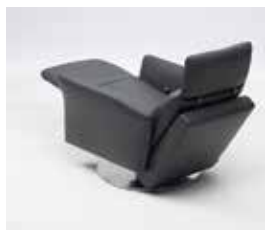
Fauteuil mit Relaxfunktion, manuell, Rancho schwarz, Tellerfuss chrom gebürstet

Mehr Inspiration zu TONUS finden Sie hier: intertime.ch Pour d'autres inspirations mettant en vedette TONUS, visitez intertime.ch For more inspiring ideas with TONUS visit: intertime.ch