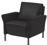
Fauteuil Fauteuil Armchair