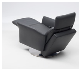
Fauteuil mit Relaxfunktion, manuell, Rancho schwarz, Tellerfuss chrom gebürstet

Mehr Inspiration zu TONUS finden Sie hier: intertime.ch Pour d'autres inspirations mettant en vedette TONUS, visitez intertime.ch For more inspiring ideas with TONUS visit: intertime.ch