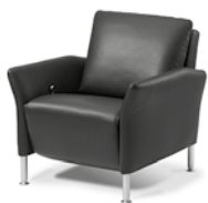
Fauteuil Fauteuil Armchair