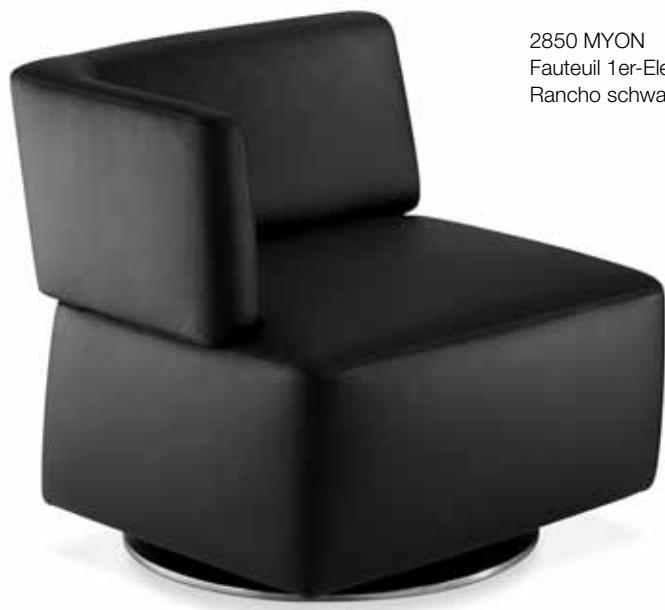
2850 MYON Fauteuil 1er-Element ATL Rancho schwarz