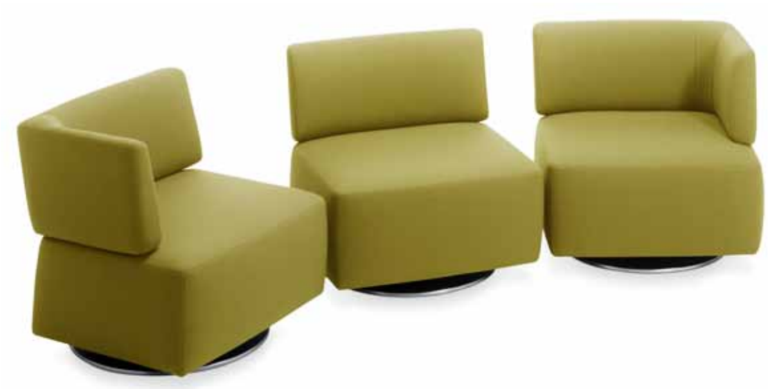
2850 MYON Fauteuil 1er-Element ATL, Fauteuil 1er-Element, Fauteuil 1er-Element ATR, alle in Vilano 12/06, Tellerfuss chrom gebürstet