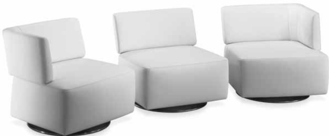
2850 MYON Fauteuil 1er-Element ATL, Fauteuil 1er-Element, Fauteuil 1er-Element ATR alle Rancho weiss, Tellerfuss chrom gebürstet