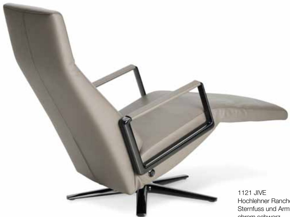
1121 JIVE Hochlehner Rancho lava, Sternfuss und Armteil chrom schwarz