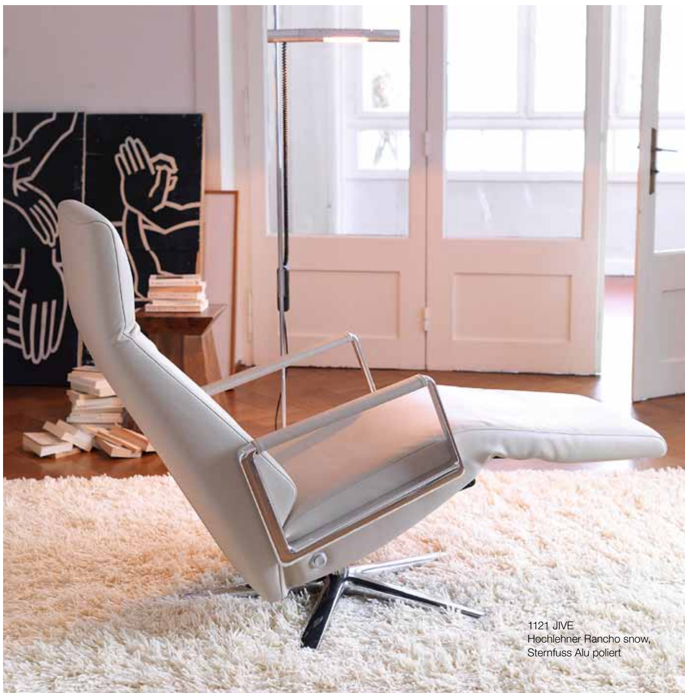
1121 JIVE Hochlehner Rancho snow, Sternfuss Alu poliert

Hochlehner relax Fauteuil bergère relax High-backed chair for relaxing