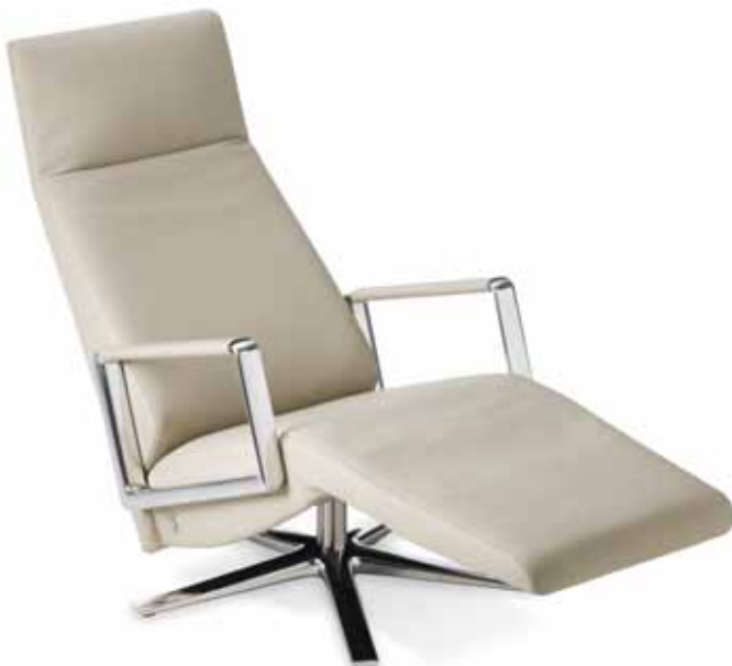
1121 JIVE Hochlehner Rancho snow, Sternfuss und Armteil Alu poliert