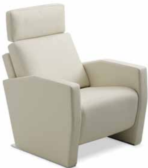
1041 LENIS Fauteuil Sierra offwhite, Kufe chrom glanz