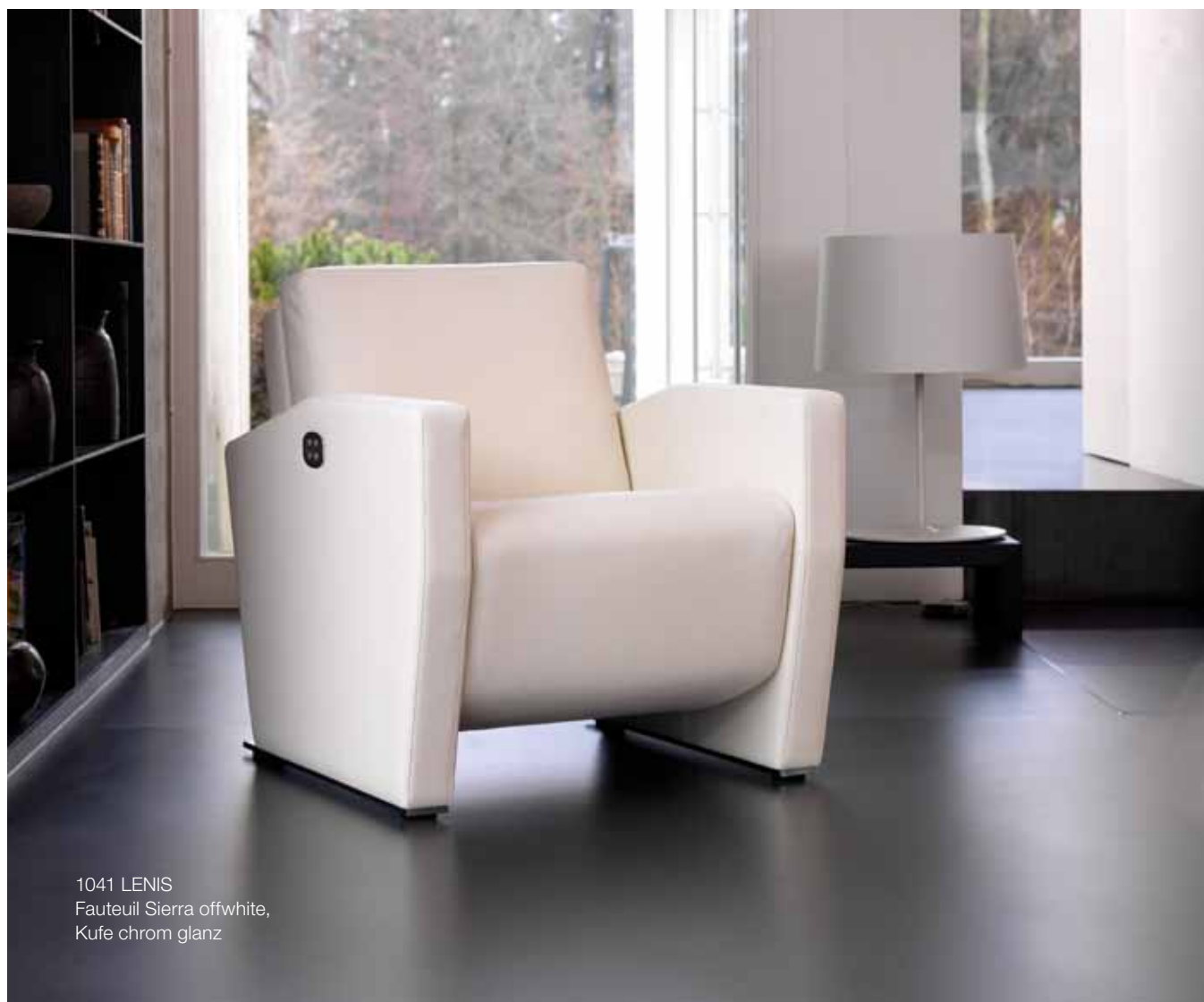
1041 LENIS Fauteuil Sierra offwhite, Kufe chrom glanz