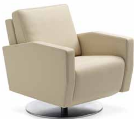
1040 LENIS Fauteuil Nevada sand, Tellerfuss chrom gebürstet