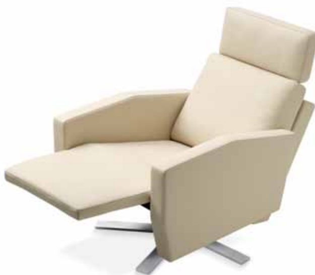
1040 LENIS Fauteuil Nevada sand, Sternfuss chrom gebürstet